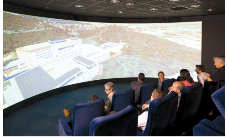
Salle immersive Le Corbusier, CSTB Sophia Antipolis