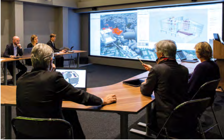
Salle Oscar Niemeyer, CSTB Paris